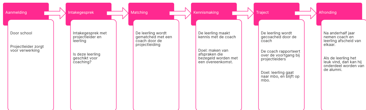
1 Het traject in hoofdlijnen